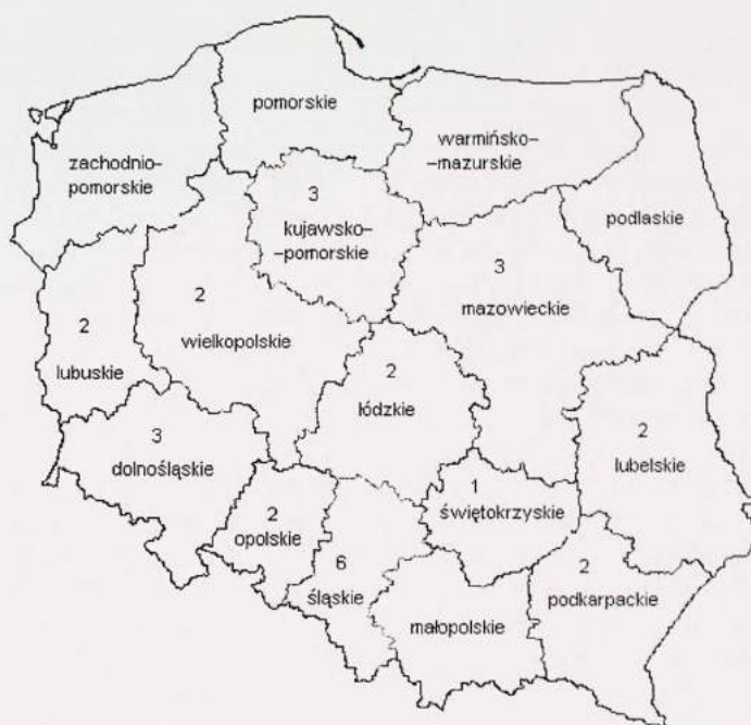
Rys. 3. Zatwierdzone projekty (I rundy) Działania 2.4 w podziale na województwa Fig. 3. Approved projects (I round) Measure 2.4 divided in regions