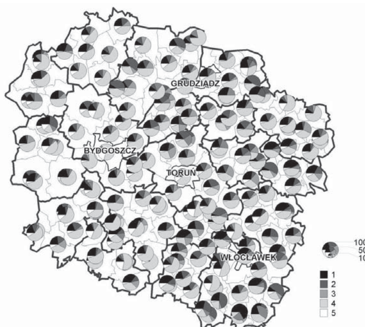
Rys. 2. Struktura działalności pozarolniczej gospodarstw indywidualnych w 2002 r. (w %)