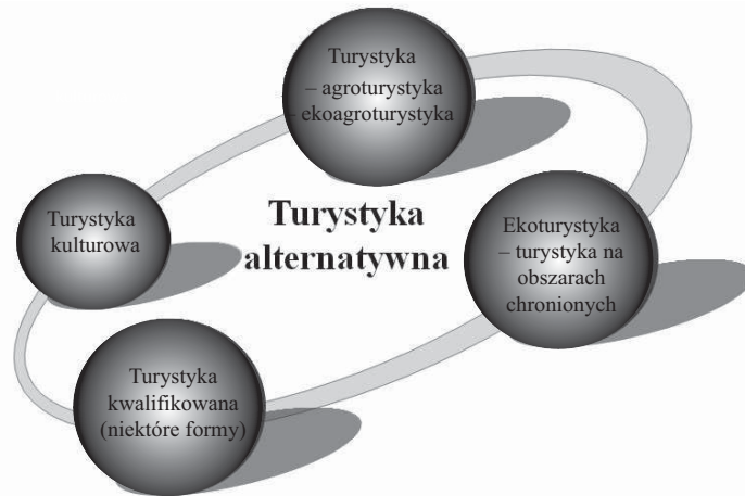
Rys. 1. Rodzaje turystyki alternatywnej Fig. 1. The types of alternative tourism